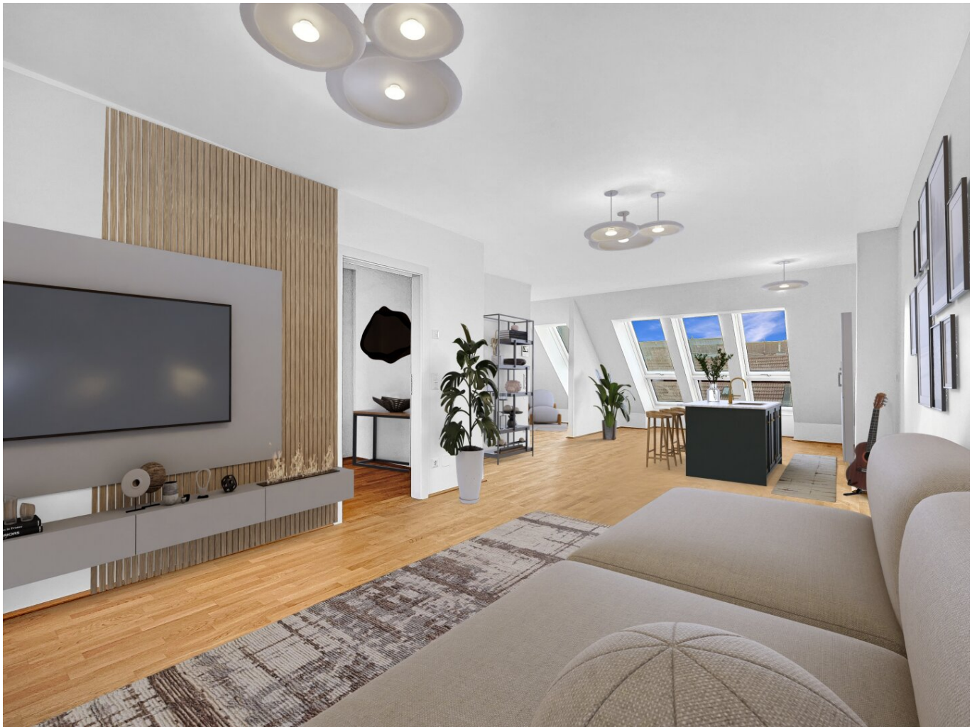
Wohnküche - Digital Staging