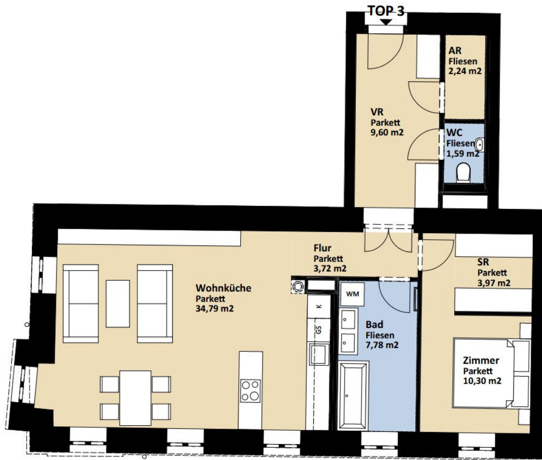
Grundriss TOP 3