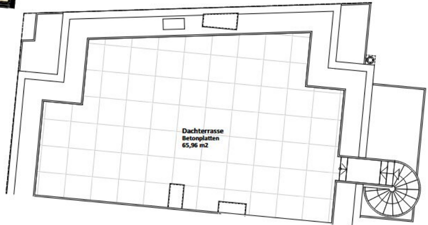
Grundriss TOP 10 Dachgeschoß 1:100