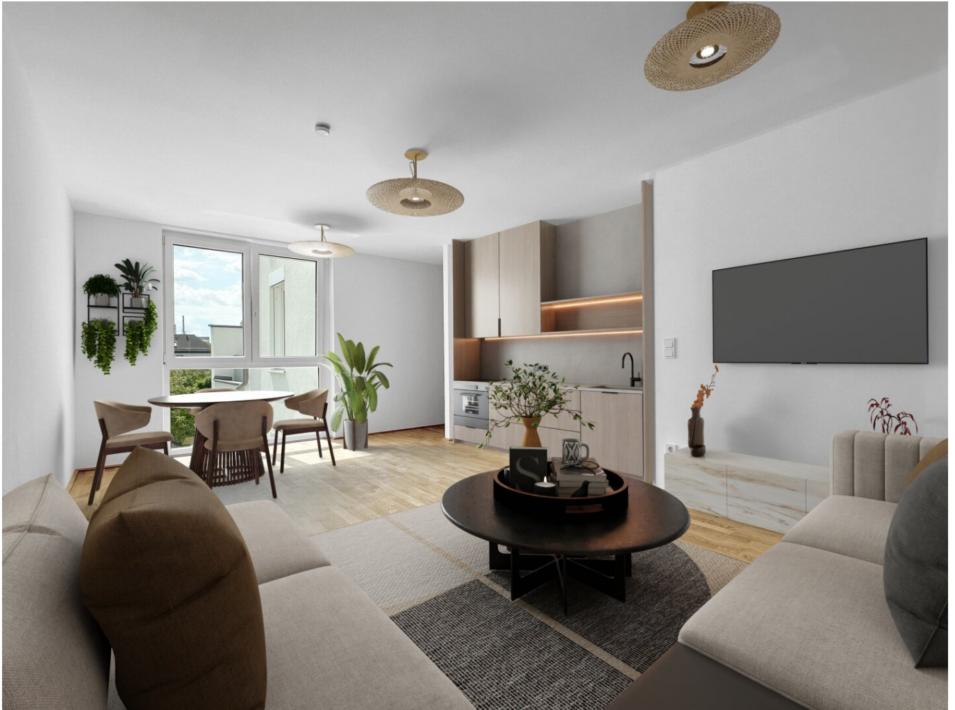
Wohnküche - Digital Staging