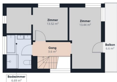
Stock 1 Gebäude 1

Ungefähre Gesamtfläche (1) 140,97 m 2 Balkone und Terrassen 6,6 m 2