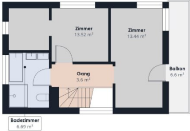
Stock 1 Gebäude 1