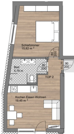
Top 2 1.UG, M 1:100