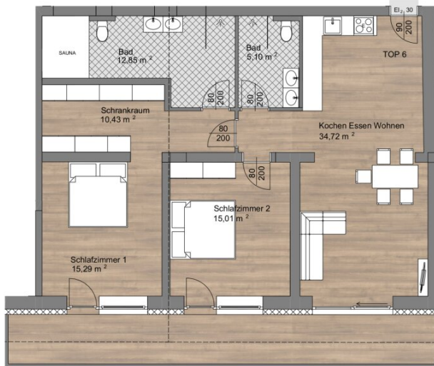
Top 6 EG, M 1:100