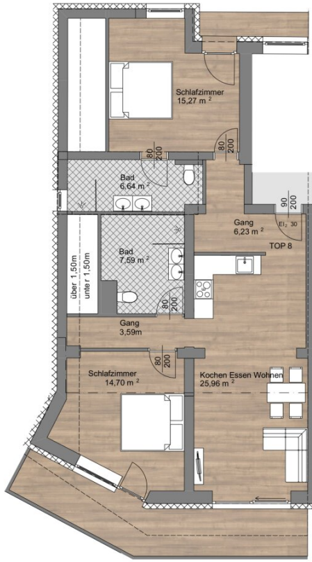
Top 8 DG, M 1:100