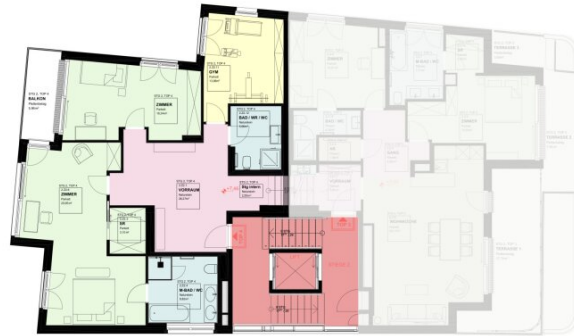
GRUNDRISS 20G 1:100 TOP 3+4