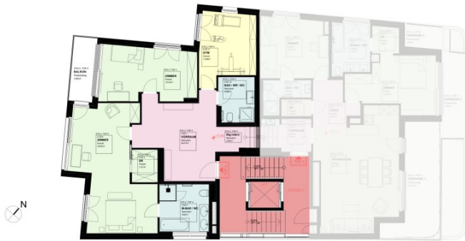
GRUNDRISS 20G 1:100 TOP 3+4