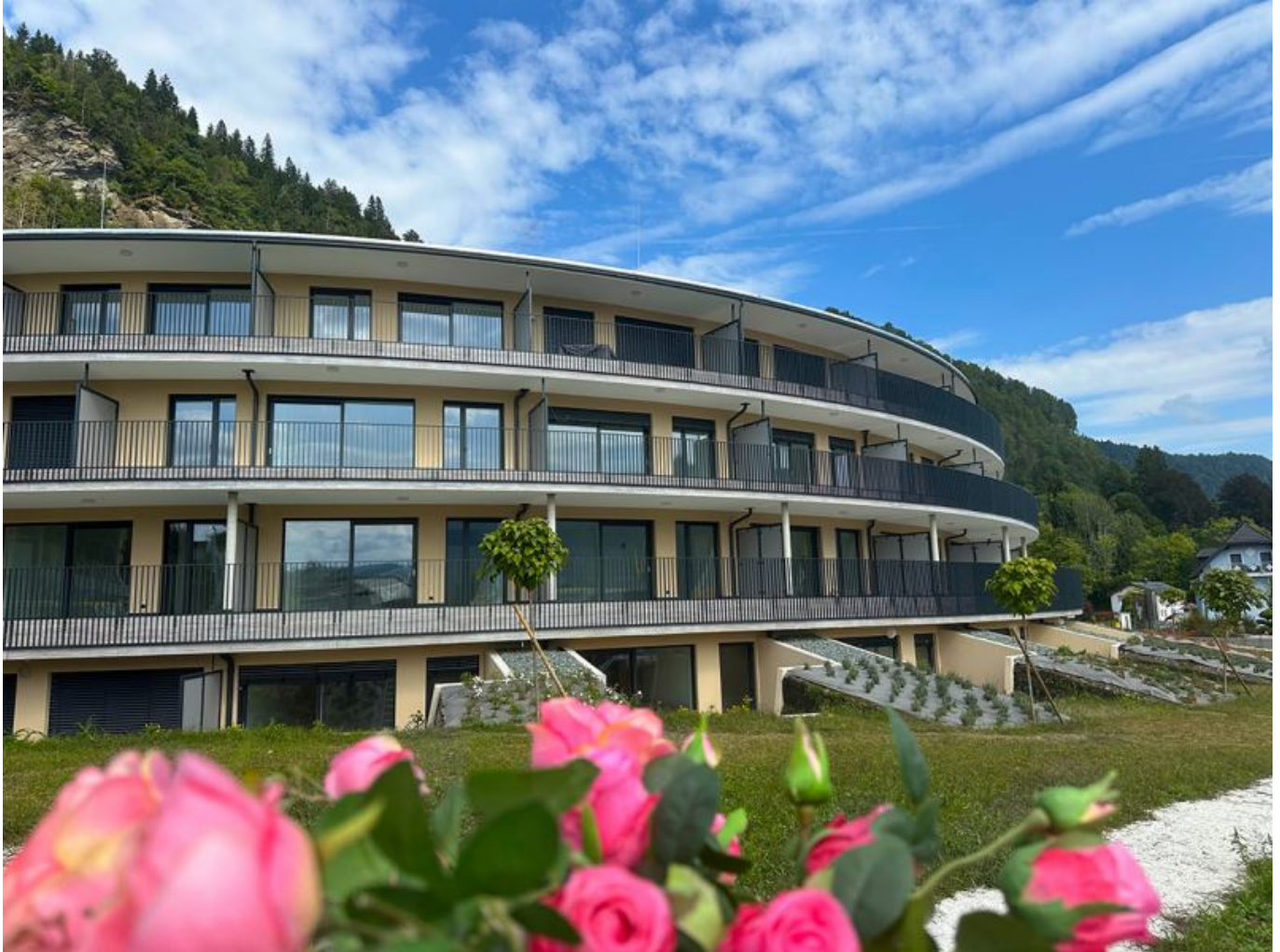
Ansicht Sept 2024 kl

Objektnummer: 905/03183 Eine Immobilie von ATV Immobilien