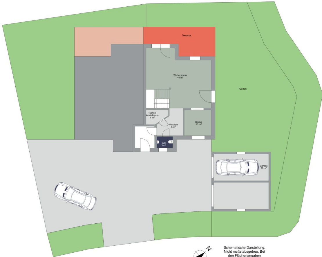
ERDGESCHOSS TOP 2