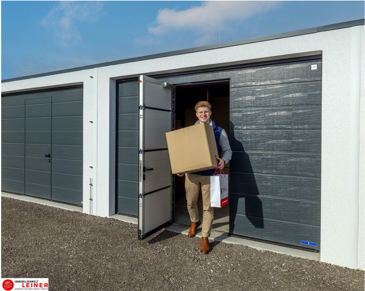
Lagerbox - Enz/Fischa