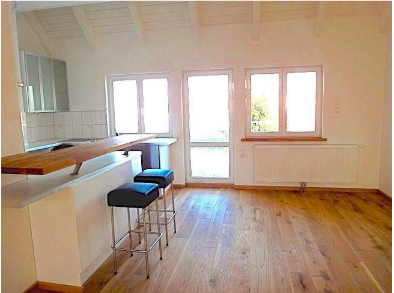
Küchenbar im Wohnraum